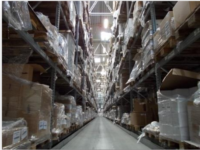
Colognola ai Colli (VR)