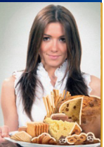
PRODOTTI DA FORNO