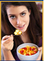
CEREALI PRIMA COLAZIONE